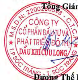
Dương Thế Nghiêm