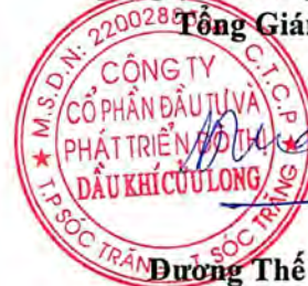
Đương Thế Nghiêm